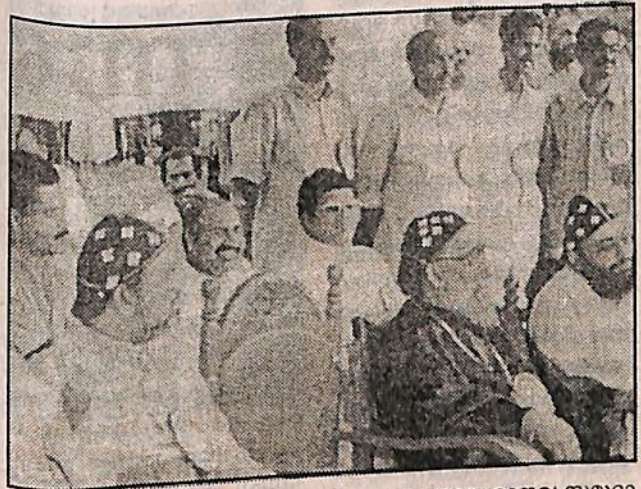
പത്തനംതിട്ട: സഭകളുടെ ഐക്യം മാത്രമല്ല മാനവ സമുദായത്തിന്റെ ഐക്യമാണ് ക്രൈസ്തവ ജനതയുടെ ലക്ഷ്യമെന്ന്